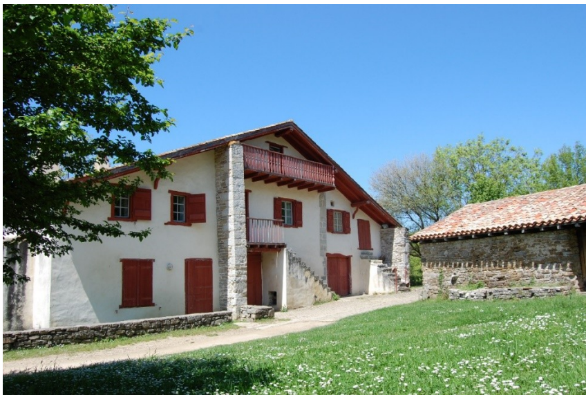
Abbadia eremuko Nekatoenea egonaldi tokia