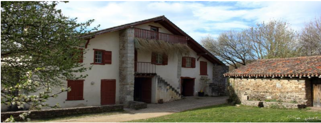
Abbadia eremuko Nekatoenea egonaldi tokia

CPIE Euskal Itsasbazterra ingurumenaren, artearen eta kulturaren heziketaren inguruan ari den elkarte bat da, 1986tik hona lurraldean ongi errotua dagoena. Deneri irekia da eta balore batzuk defendatzen ditu, hala nola elkartasuna, kultura eta hizkuntza ezberdintasunen errespetua, autonomia, herritarren erantzunkizuna ingurumenaren babestean aktiboki parte hartuz, ongi izate soziala eta gure lurraldearen garapen iraunkorra. Badu 20 urte Hendaiaiko Abbadiako eremuan kokatua den Nekatoenea etxe berriak artista egonaldiak errezibitzen dituela.